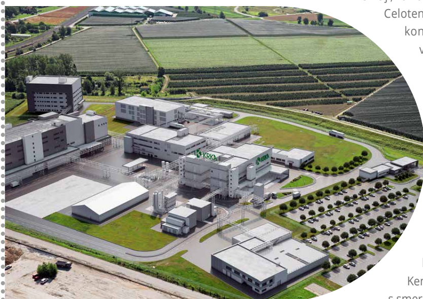
Prikaz končnega stanja Krkine proizvodne lokacije v Krškem